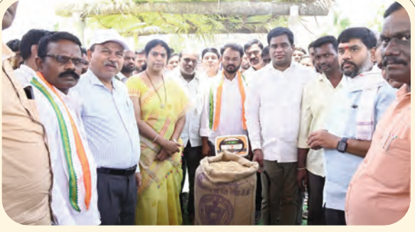
మొక్కజొన్న కొనుగోలు కేంద్రాన్ని ప్రారంభిస్తున్న కలెక్టర్