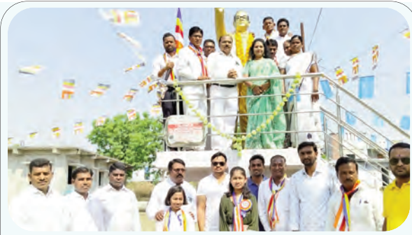
అంబేద్కర్ విగ్రహానికి పూలమూల వేసిన సాసైటి సభ్యులు