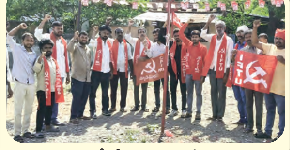
జెండాను ఆవిష్కరణలో పిడిఎన్యూ కొమురంభోం జిల్లా నాయకులు