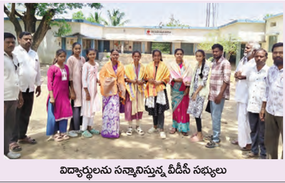
విద్యార్థులను సన్మానిస్తున్న వీడిసీ సభ్యులు