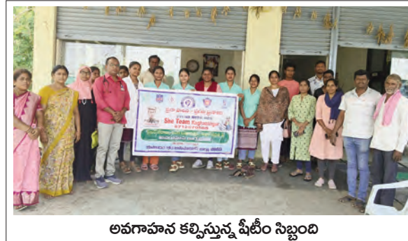
అవగాహన కల్పిస్తున్న పీటీఐ సిబ్బంది