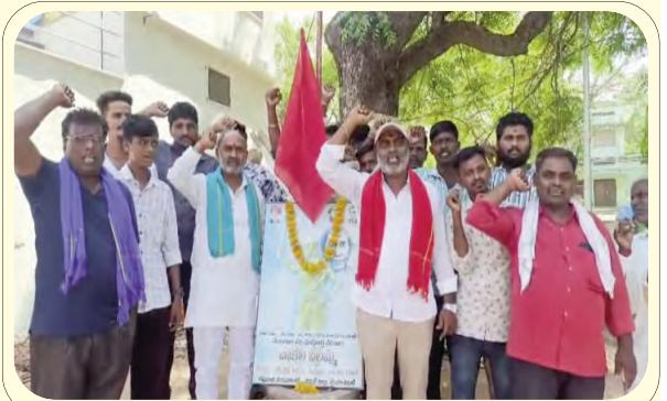
జెండాను ఆవిష్కరణలో పిడిఎన్యూ కొమురంభోం జిల్లా నాయకులు