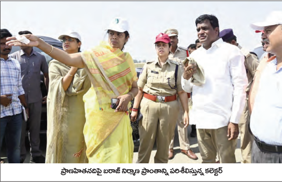
ప్రాణహితనదిపై బరాజ్ నిర్మాణ ప్రాంతాన్ని పరిశీలిస్తున్న కలెక్టర్