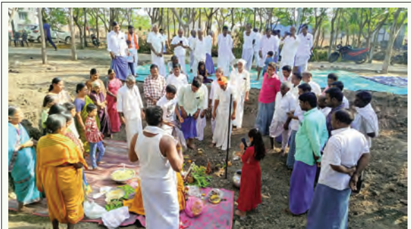
తేజాపూర్ గ్రామంలో రామాలయ నిర్మాణానికి భూమి పూజ చేస్తున్న వేద పండితులు, గ్రామస్థులు

మండలంలోని తేజాపూర్ గ్రామంలో రామాలయ నిర్మాణానికి శుక్రవారం ఘనంగా భూమి పూజ చేశారు. వేద పండితుల మంత్రోచ్ఛారణల మధ్య శాస్త్రోక్తంగా ప్రత్యేక పూజలు నిర్వహించి ఆలయ నిర్మాణ పనులను ప్రారంభించారు. ఈ కార్యక్రమంలో గ్రామస్థులు అధిక సంఖ్యలో పాల్గొని భక్తిశ్రద్ధలతో మొక్కులు తీర్చుకున్నారు. గ్రామంలో ఆధ్యాత్మిక వాతావరణం నెలకొనేలా ఆలయాన్ని నిర్మిస్తున్నట్లు నిర్వాహకులు తెలిపారు. పవిత్రమైన ఈ వేడుకలో తేజాపూర్ ప్రజలు ఉత్సాహంగా పాల్గొన్నారు.