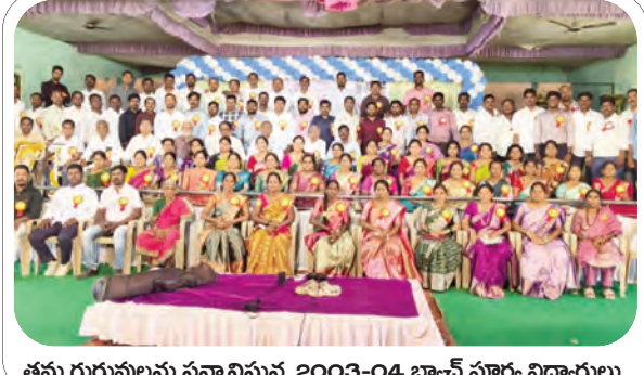
తమ గురువులను సన్మానిస్తున్న 2003-04 బ్యాచ్ పూర్వ విద్యార్థులు.